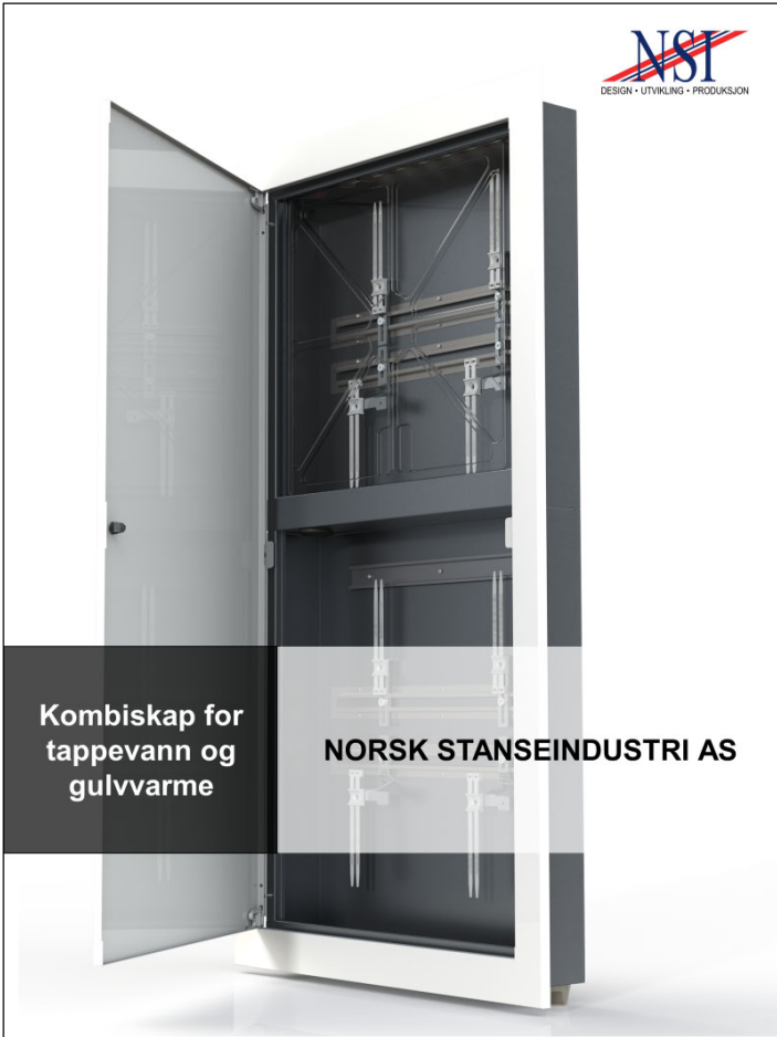
Kombiskap for tappevann og gulvvarme